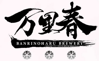
万里春酒造 / 富田林