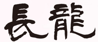
長龍酒造 / 八尾