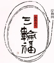
井坂酒造場 / 岸和田