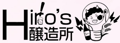
Hiro's 醸造所 / 堺