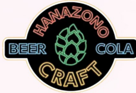
花園クラフト / 東大阪