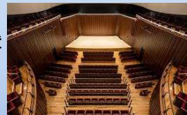
浦安音楽ホール・コンサートホール

※アランフェス協奏曲第2楽章(ロドリゴ) ※ギター協奏曲第2楽章(ヴィラ=ロボス) ※亡き王女のためのパヴァーヌ(ラヴェル) ・悲歌風幻想曲作品59(ソル)・羽衣伝説(藤井敬吾)・「ギターのための新12の歌」より(壺井一歩編曲)・2つのベネズエラワルツ~カローラ、エル・マラヴィーノ(ラウロ)、他 ※=ピアノとのデュオ