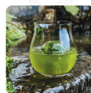
Cloch Mhoir カクテル、モクテル