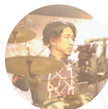
渡辺 庸介 パーカッションист