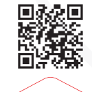
more info 店舗情報