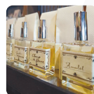
Un Jour フレグランス他