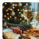
UNJUOR MARCHE シャンパーニュ、チーズ