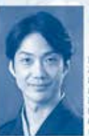
野村 萬斎 のむら まんさい 1946年生、東京芸術大学卒、舞臺芸術文化財団指定保持者「狂言ござる乃度」主演、能狂言公演に出演の色、TV・舞台などでも幅広く活躍、芸術界新人賞、芸術選奨文部科学大臣賞受賞、芸術祭優秀賞等受賞多数、主な著書に『萬斎でござる』、『狂言サイボーグ』などがある。