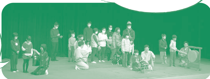
お囃子体験のようす

お囃子体験をはじめ、落語を子どもと楽しむという企画自体が面白く新鮮。一緒に参加した孫も喜んでました。(一般)