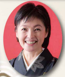
総合演出 徳永玲子