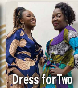
Dress for Two