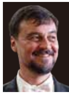
ライナー・キューブルベック (トランペット)

Shinichi Go, Trombone 大阪フィル首席を20年間務め、現在、京都市立芸術大学名誉教授、大阪音楽大学・相愛大学各客員教授。