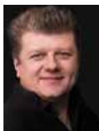
ラデク・バボラーク(ホルン)