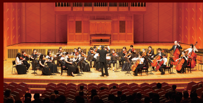
秋田青少年オーケストラ 指揮：成田 徹、音楽監督：羽川 武

2025 1.26 (sun) 開演 14:00 | あきた芸術劇場ミルハス (開場 13:15) 大ホール