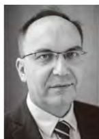
アルトゥル・シュクネル