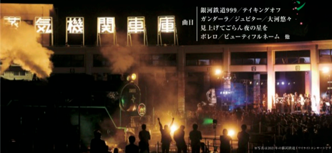
※写真は2021年の銀河鉄道(トワイライトコンサート)です

銀河鉄道999 / ティキングオフ ガンダーラ / ジュビター / 大河悠々 見上げてごらん夜の星を ボレロ / ビューティフルネーム 他