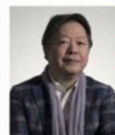
タケカワ ユキヒデ(音楽家/ゴダイゴ)

2005-2007年マケドニア日ユゴ国立歌劇舞音楽指揮者。2007年国連コソボ暫定行政ミッション下のコンボフィル首席指揮者に就任。同年バルカン半島の民族共栄を願ってパリカン室内管弦楽団を設立。2016年ジュネーブ国連欧州本部総会場で演奏を披露。2019年音楽を通じた地域と平和への尽力により、コンボ大統領勲章(文化功労賞)を叙される。現在、バルカン室内管弦楽団音楽監督、コンボフィル首席指揮者、ペオグランド・シンフォニエッタ名誉首席指揮者、車日本大震災の復興支援として坂本龍一氏が音楽監督を務める東本コースのオーケストラ指揮者、著書「バルカンから届け1枚の歌(音楽者)」。2020年より京都フィルハーモニー室内合奏団ミュージックパートナー。 詳しくは公式サイトHP https://toshiyoganagisawa.com