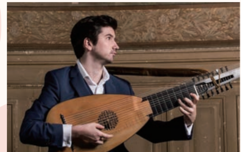
リュート トーマス・ダンフォード Thomas Dunford